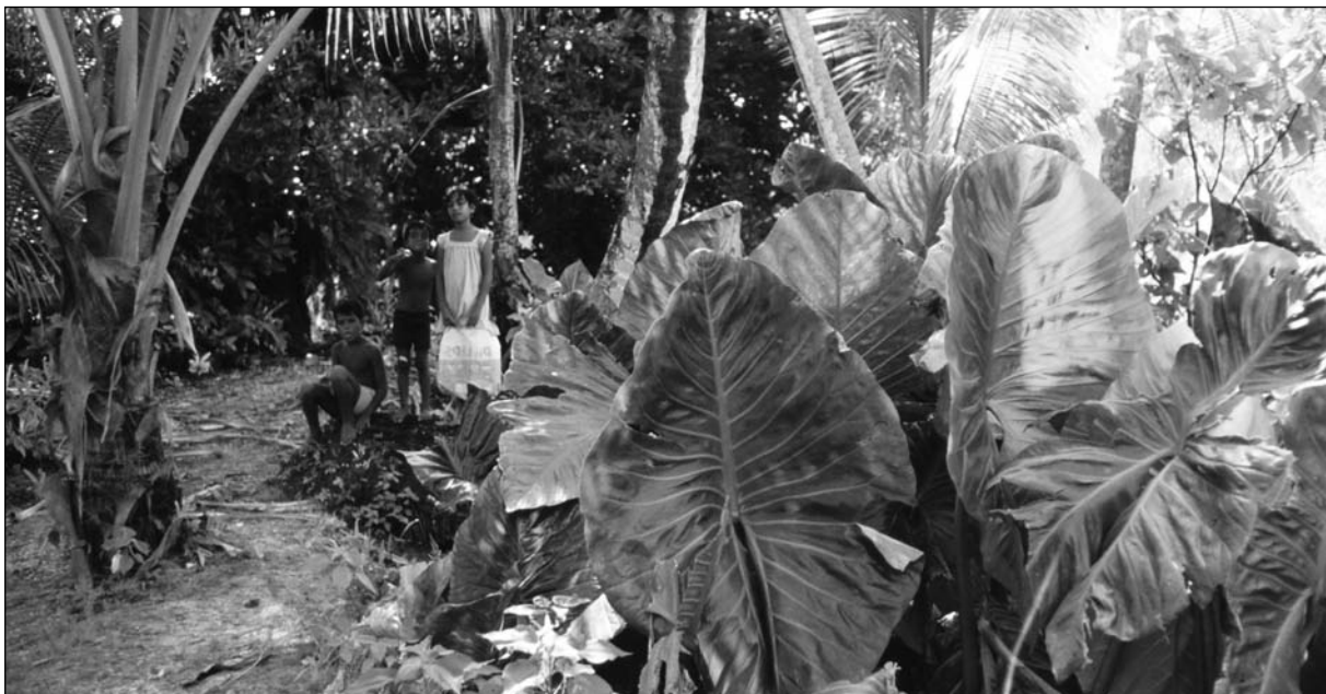
Pulaka-Pflanzen in Tuvalu

Ein gesundes und funktionierendes Ökosystem ist für Tuvalu extrem wichtig, denn sowohl die Subsistenzlandwirtschaft als auch der Verkauf landwirtschaftlicher Produkte sind für die Wirtschaft und die Ernährung der Bevölkerung von essenzieller Bedeutung. Etwa 80 Prozent der Bevölkerung über 15 Jahren sind im Agrarsektor oder der Fischerei tätig, und nur ein geringer Anteil der Bevölkerung hat bezahlte Anstellungen im öffentlichen oder privaten Sektor im städtischen Funafuti oder