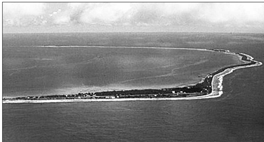
Tuvalu ist an seinem breitesten Punkt nur 400m breit.