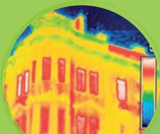
Andreas Starke Oberbürgermeister